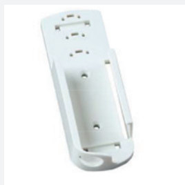
EBI 300-WM2 Wall Mount for EBI 300 / 310

Meerdere externe sensoren mogelijk. Meer informatie beschikbaar op aanvraag.